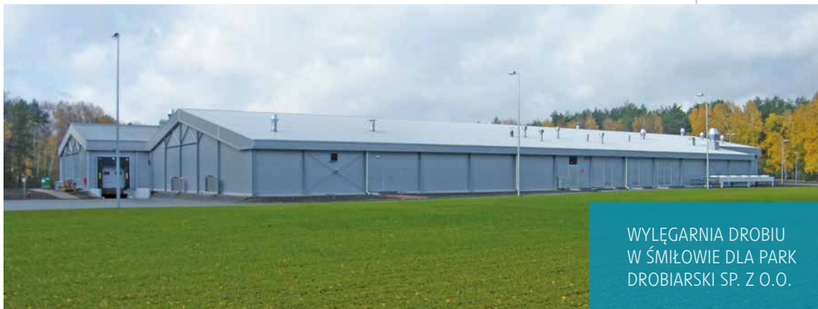
WYLĘGARNIA DROBIU W ŚMIŁOWIE DLA PARK DROBIARSKI SP. Z O.O.