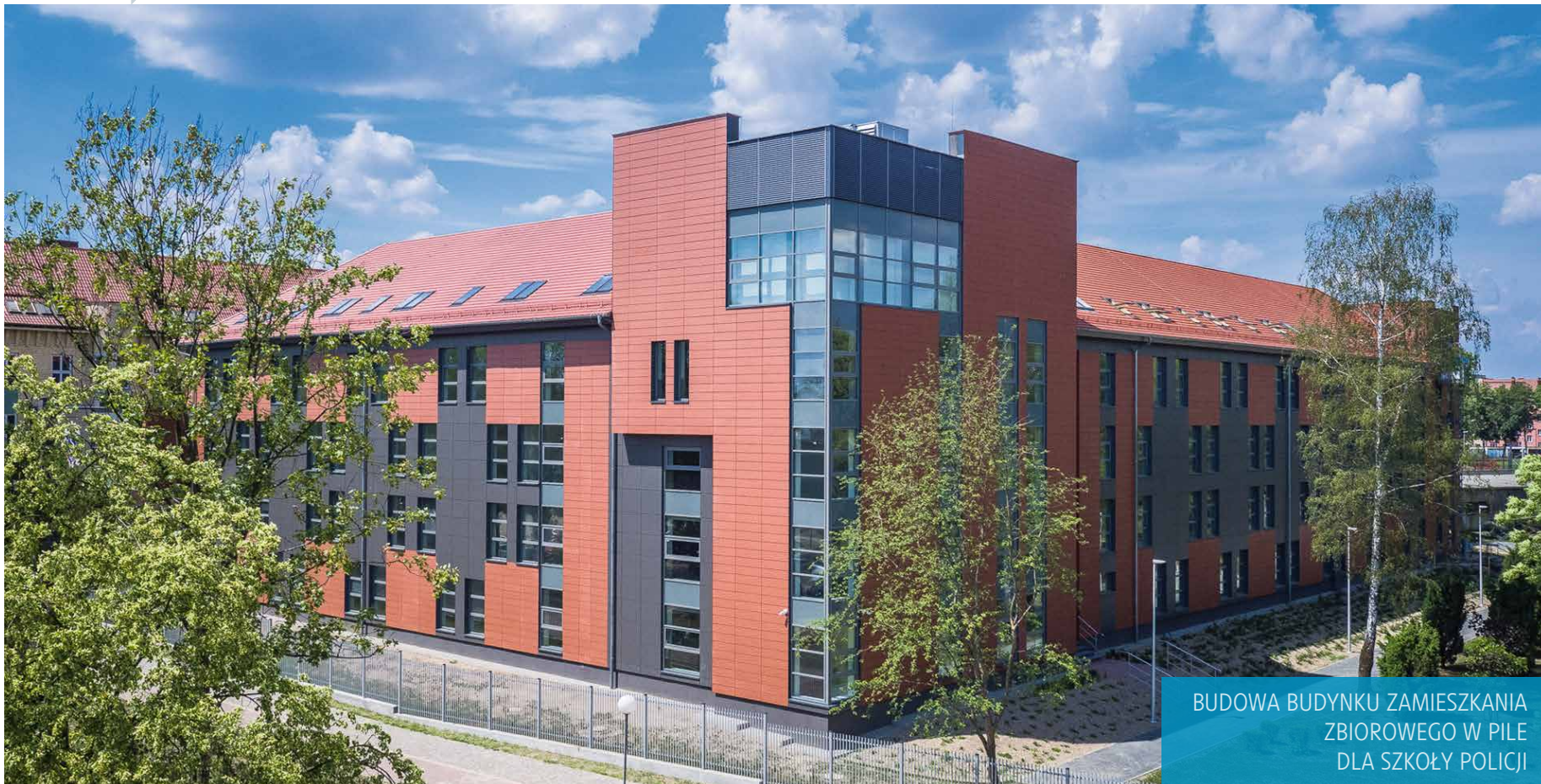
BUDOWA BUDYNKU ZAMIESZKANIA ZBIOROWEGO W PILE DLA SZKOŁY POLICJI