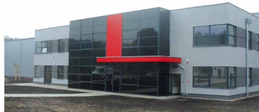
HALA MAGAZYNOWA Z BUDYNKIEM ADMINISTRACYJNO-SOCJALNYM W PILE DLA SAF-HOLLAND SP. Z O.O.