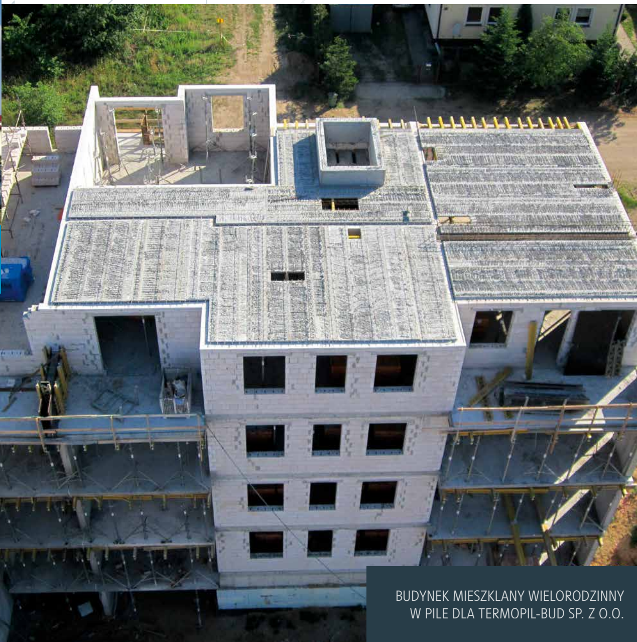
BUDYNEK MIESZKLANY WIELORODZINNY W PILE DLA TERMOPIL-BUD SP. Z O.O.