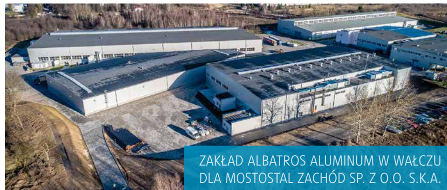
ZAKŁAD ALBATROS ALUMINUM W WAŁCZU DLA MOSTOSTAL ZACHÓD SP. Z O.O. S.K.A.