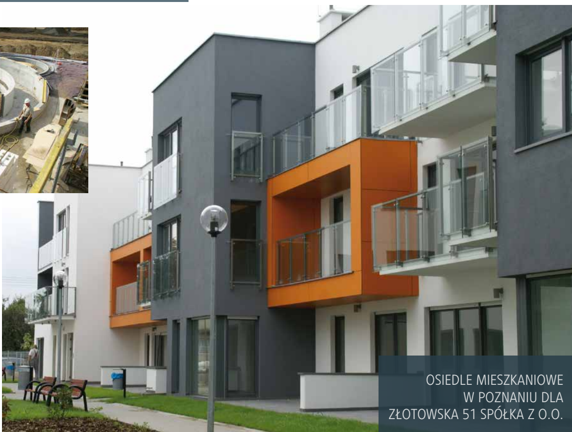
OSIEDLE MIESZKANIOWE W POZNANIU DLA ZŁOTOWSKA 51 SPÓŁKA Z O.O.