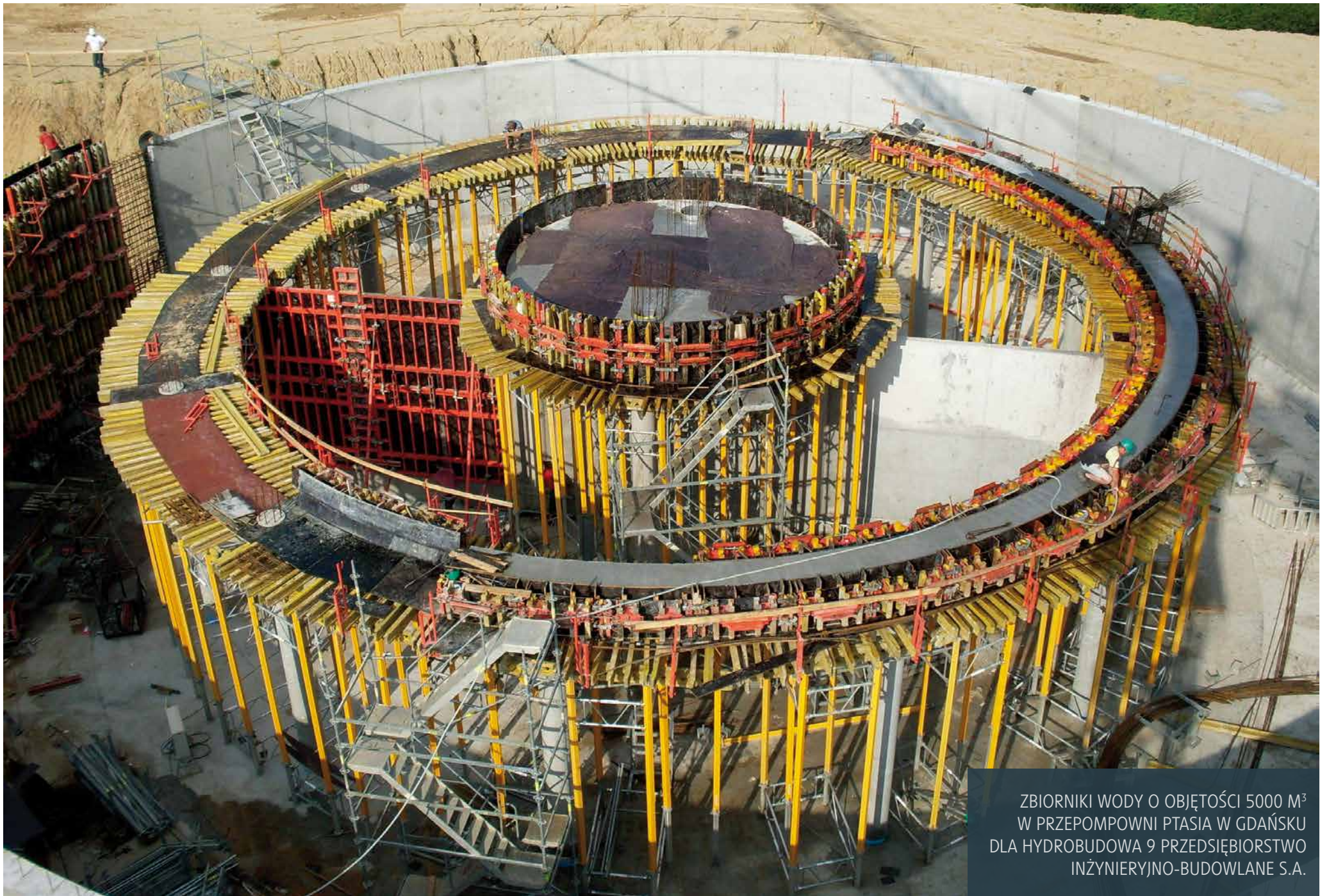
ZBIORNIKI WODY O OBJĘTOŚCI 5000 M 3 W PRZEPOMPNI PTASIA W GDAŃSKU DLA HYDROBUDOWA 9 PRZEDSIĘBIORSTWO INŻYNIERYJNO-BUDOWLANE S.A.