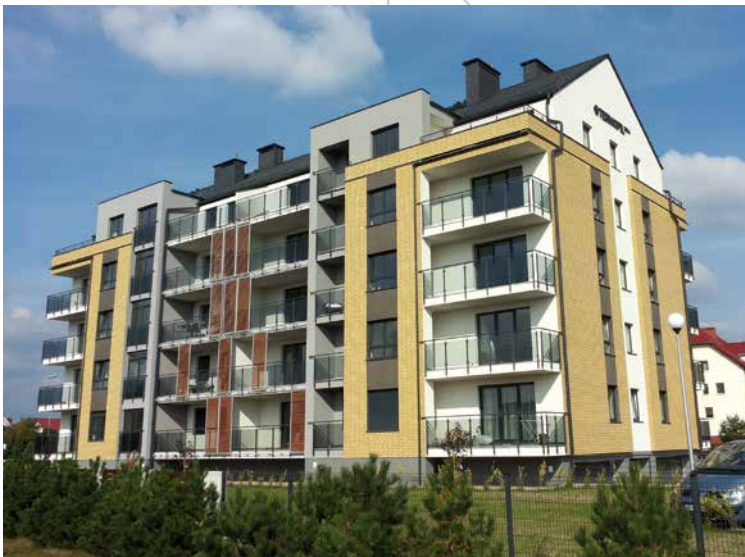
BUDYNEK WIELORODZINNY W PILE DLA TERMOPIL-BUD SP. Z O.O.