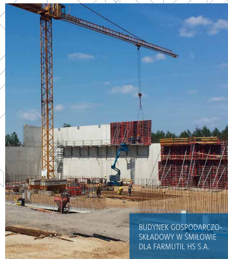
BUDYNEK GOSPODARZO- SKŁADOWY W ŚMIŁOWIE DLA FARMUTIL HS S.A.