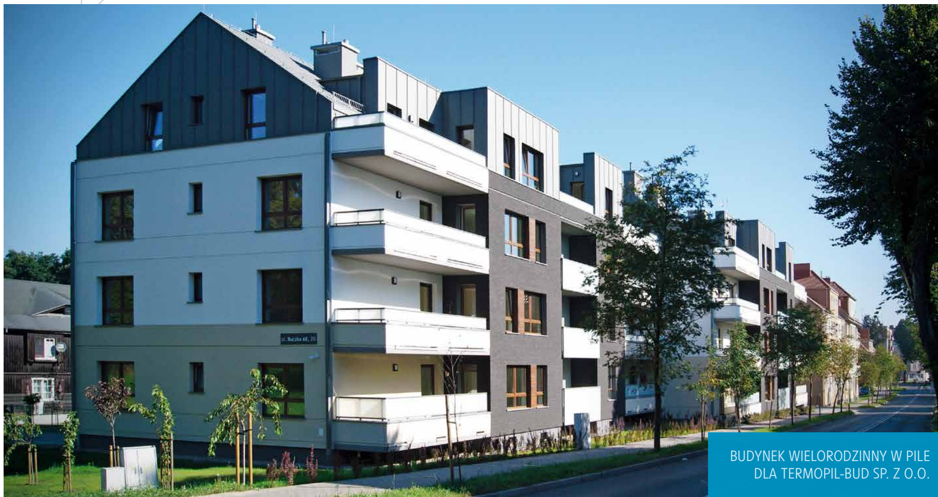
BUDYNEK WIELORODZINNY W PILE DLA TERMOPIL-BUD SP. Z O.O.