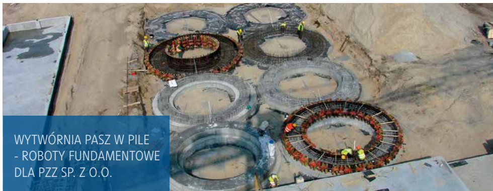
WYTWÓRNIA PASZ W PILE - ROBOTY FUNDAMENTOWE DLA PZZ SP. Z O.O.