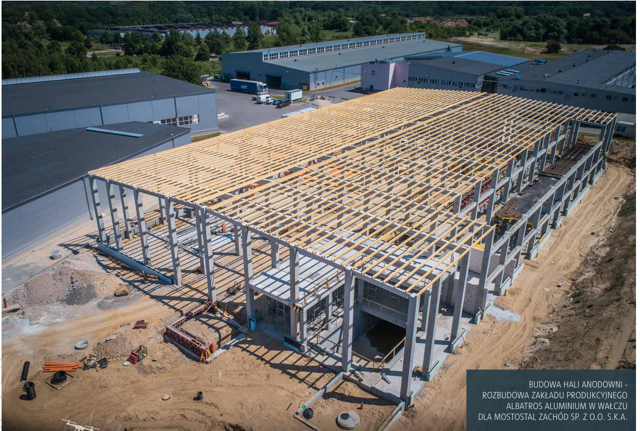
BUDOWA HALI ANODOWNI - ROZBUDOWA ZAKŁADU PRODUKCYJNEGO ALBATROS ALUMINIUM W WAŁCZU DLA MOSTOSTAL ZACHÓD SP. Z O.O. S.K.A.