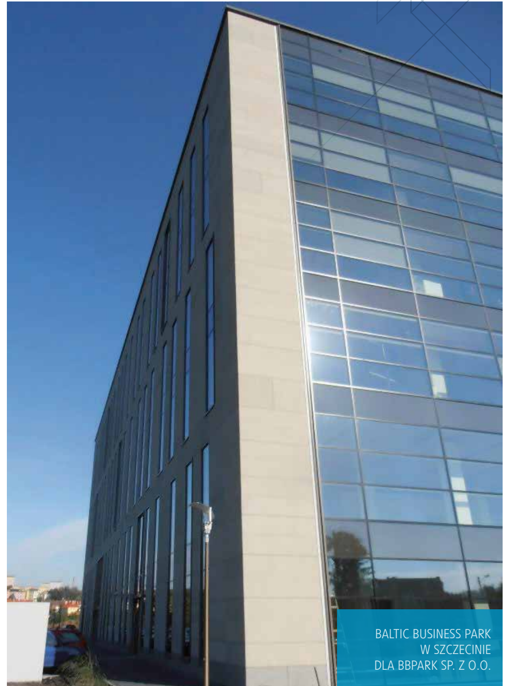
BALTIC BUSINESS PARK W SZCZECINIE DLA BBPARK SP. Z O.O.