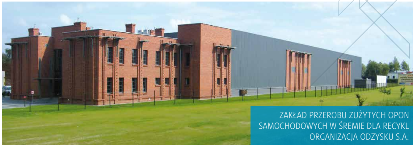
ZAKŁAD PRZEROBU ZUŻYTYCH OPON SAMOCHODOWYCH W ŚREMIE DLA RECYKL ORGANIZACJA ODZYSKU S.A.

POTWIERDZENIEM RZETELNOŚCI FIRMY SĄ LICZNE NAGRODY, WYRÓŻNIENIA ORAZ REFERENCJE ŚWIADCZĄCE O PROFESJONALIZMIE I ZADOWOLENIU Z USŁUG NASZYCH KLIENTÓW.