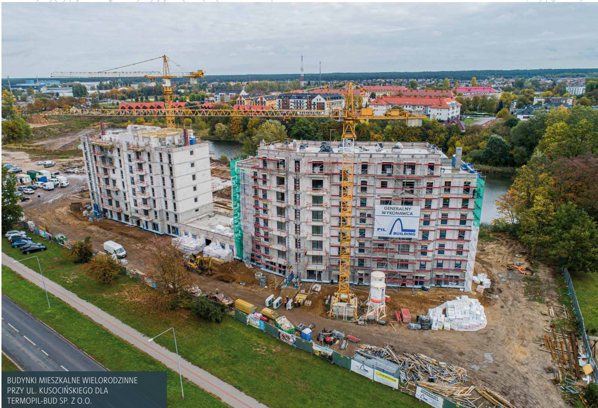
BUDYNKI MIESZKALNE WIELORODZINNE PRZY UL. KUSOCIŃSKIEGO DLA TERMOPIL-BUD SP. Z O.O.