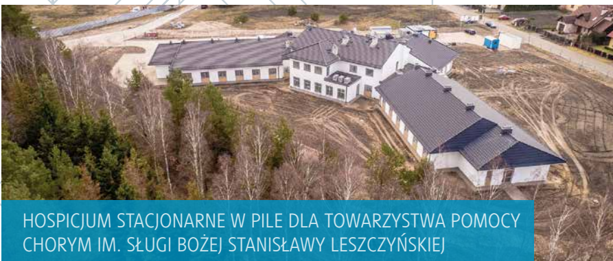
HOSPICJUM STACJONARNE W PILE DLA TOWARZYSTWA POMOCY CHORYM IM. SŁUGI BOŻEJ STANISŁAWY LESZCZYŃSKIEJ