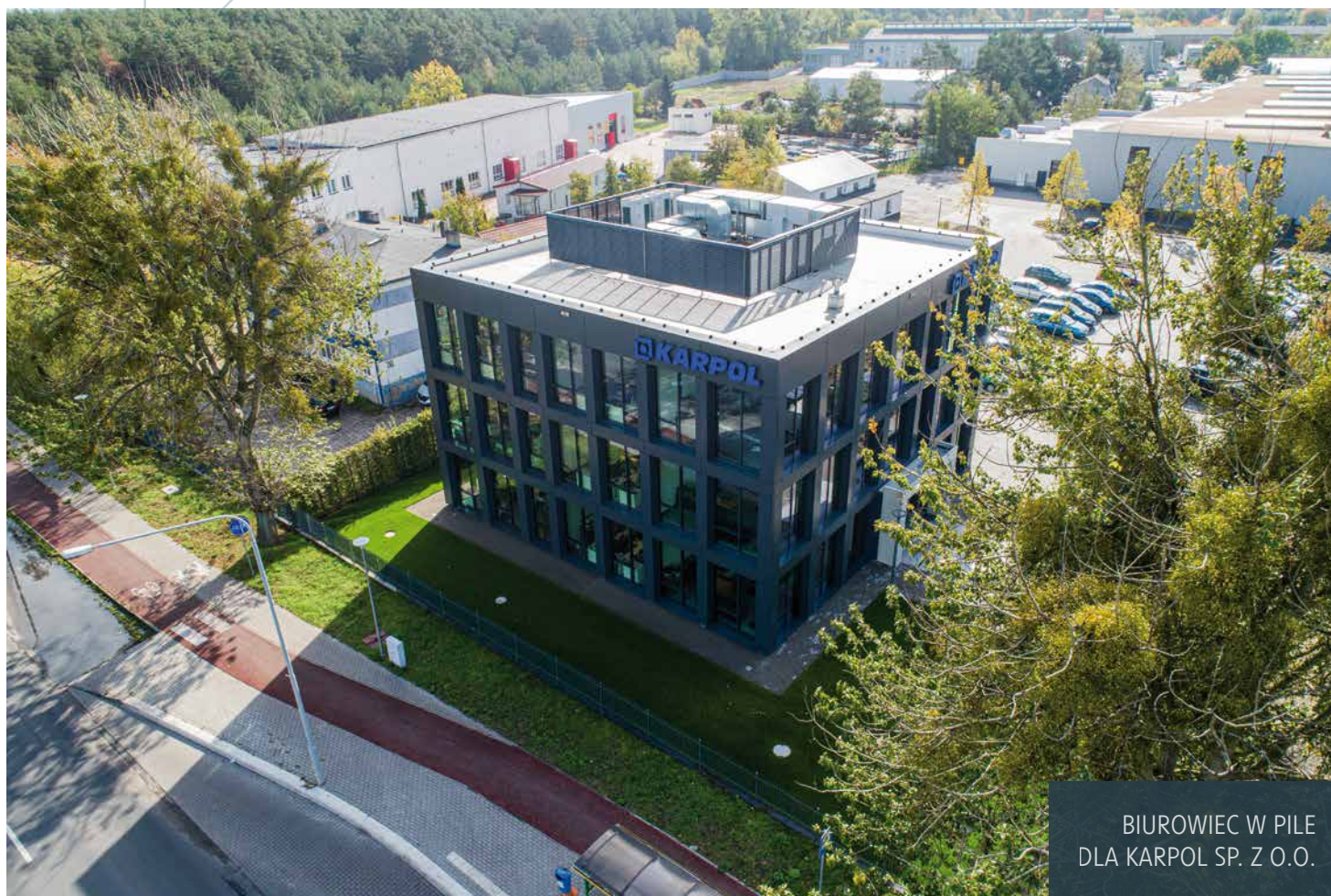
BIUROWIEC W PILE DLA KARPOL SP. Z O.O.