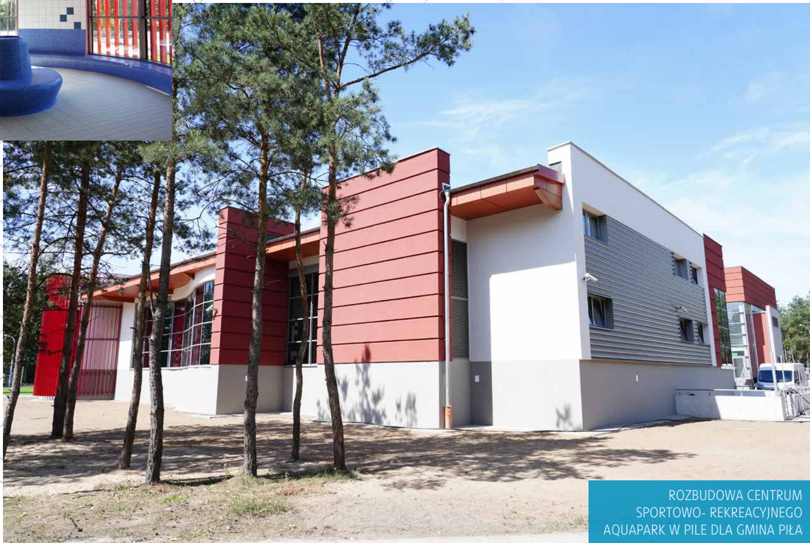
ROZBUDOWA CENTRUM SPORTOWO- REKREACYJNEGO AQUAPARK W PILE DLA GMINA PIŁA